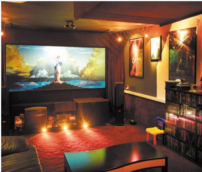
Het referentietheater van ITC Home Theater.

om een gekwalificeerd iemand dit te laten doen. U denkt nu misschien aan uw dealer en wanneer dit een goede dealer is, is die gedachte terecht. Hij zal met een afregel-DVD de televisie bij u thuis afregelen. De kwalificaties waar ik op doel gaan echter een heel stuk verder, ik ken dan ook geen dealers die dit voor u kunnen doen, want waar ik op doel is een ISF-gecertificeerde kalibratie van uw televisie. In de USA hier zelfs een opleiding met een daaraan verbonden keurmerk voor. De ISF, de Imaging Science Foundation ( www.imaging-science.com ), is een stichting die opleidingen op dit terrein verzorgt. De kalibraties zijn één van de terreinen waarop de ISF zich bezighoudt. ISF gecertificeerde dealers proberen uw televisie of projector zo dicht mogelijk bij de PAL-referentie te krijgen. Ze halen het maximale uit uw televisietoestel.